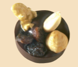
55000 Tarragonins negros