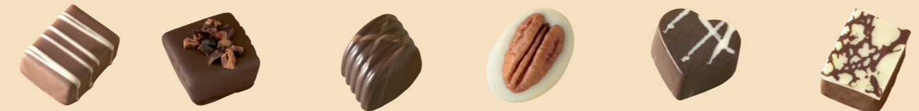
55030 Caramelins Trufa caramelo 55029 Ghana Trufa cacao Ghana 55034 Assam Trufa de té a la naranja 55074 Locarno Praliné nuez y almendra 55036 Natalins Trufa al Baileys 55039 Cremoso Crema chocolate a la gianduya