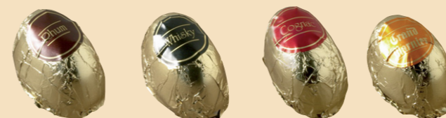
Ron Whisky Cognac Gran Marnier