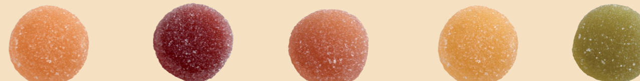
Albaricoque Frambuesa Fresa Limón Pera