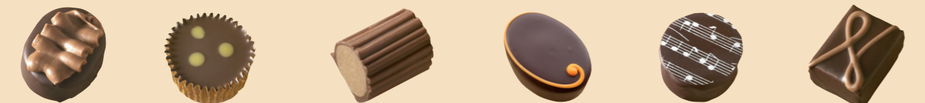
55050 Moka Trufa café 55051 Borodin Trufa Cocktail 55052 Zurich Gianduya almendra 55053 Altea Trufa naranja 55078 Concerto Trufa aromas florales 55057 Marbella Trufa al limón