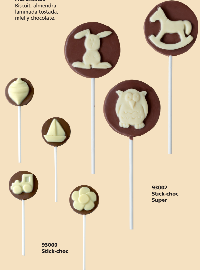
93002 Stick-choc Super