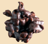
65010 Rocs suizos negros