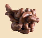
65020 Rocs suizos leche