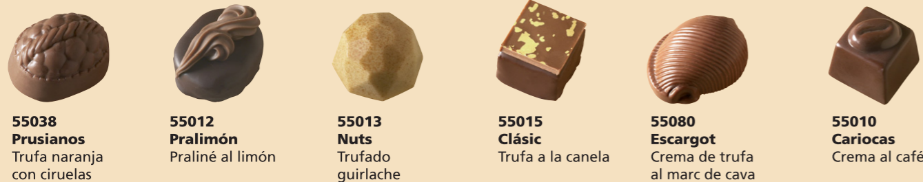
55038 Prusianos Trufa naranja con ciruelas 55012 Pralimón Praliné al limón 55013 Nuts Trufado guirlache 55015 Clásic Trufa a la canela 55080 Escargot Crema de trufa al marc de cava 55010 Cariocas Crema al café