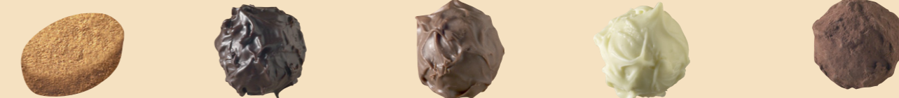
55082 Ceylan Praliné especias, canela, clavo, nuez moscada. 54010 Exquis N. Trufa estilo suizo cognac 54020 Exquis L. Trufa estilo suizo cóctel 54030 Engadin Trufa estilo suizo kirsch 54060 Exquis Bitter Trufa amarga