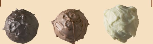
53520 Erizo cob. N 53510 Erizo cob. L 53530 Erizo cob. B