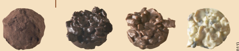
53540 Erizo Bitter