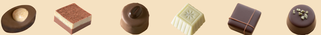
55056 Cerdeña Praliné almendra 55097 Cadaqués Praliné Al + Praliné Av 55070 París Trufa café arábigo 55055 Bitter Trufa amarga 55041 Colombo Ganache de canela 55042 Mojito Ganache ron, lima, hierbabuena