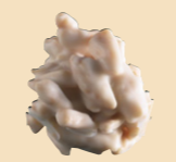
65030 Rocs suizos blancos