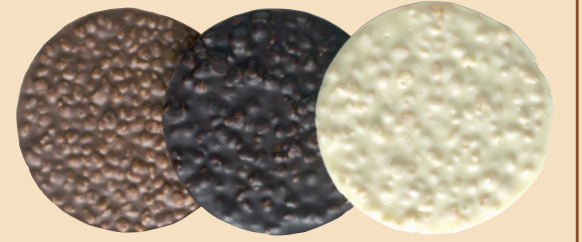
61012 Arroz cob. L 61011 Arroz cob. N 61013 Arroz cob. B