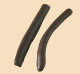
53010 Tiras naranja