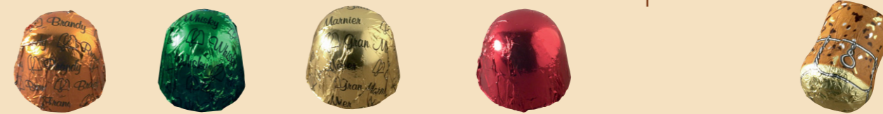
Brandy Whisky Gran Marnier 55516 Guinda Licor Reserva al brandy 58010 Taps de champagne Licor marc de champagne