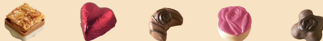
98011 Bombón Florentino Florentina sobre praliné almendra 98081 Corazón Rojo Praliné avellana 55019 Damalins Praliné guirlache de almendra 55081 Bombón Rosa Trufa licor de rosas 55079 Avellanins Avellanas caramelizadas