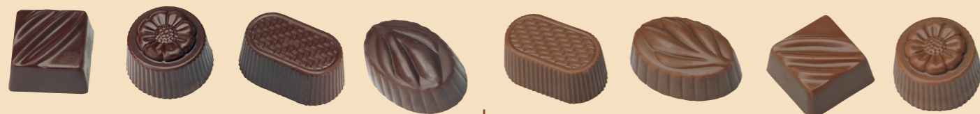
54510 Surtido Diet-SIN AZÚCAR Negro