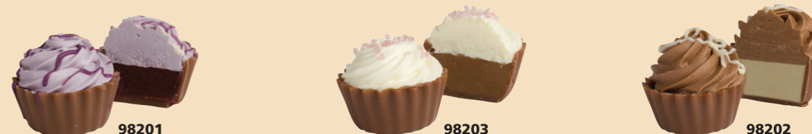
98201 Frutas bosque 98203 Praliné Almendra 98202 Capuccino