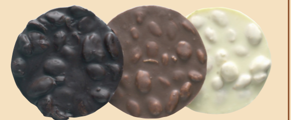
61021 Almendra cob. N. 61022 Almendra cob. L. 61023 Almendra cob. B.