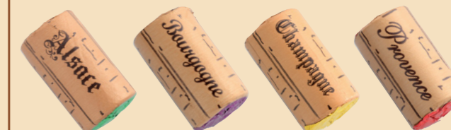
Alsace Bourgogne Champagne Provence