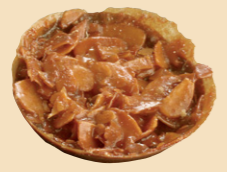
98010 Florentinas Biscuit, almendra laminada tostada, miel y chocolate.